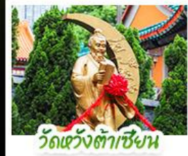
วัดเข่งต้าเซิน