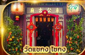
วัดเขกง ไชกง