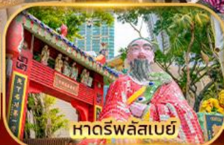
หาดร์พลัสเบย์