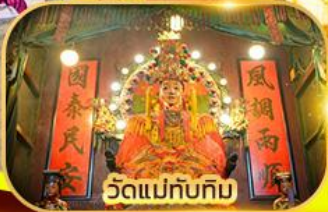
วัดแม่ทับทิม