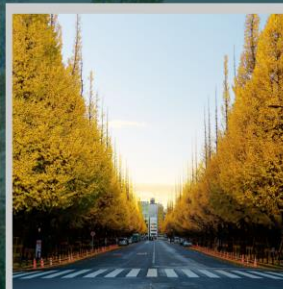
“ICHONAMIKI GINGO AVENUE”