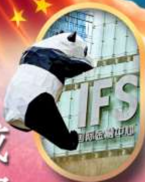
IFS หมีแพนด้าป็นดัก