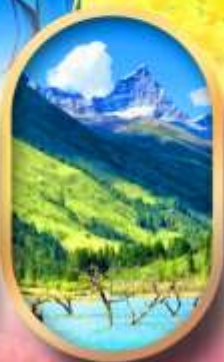
อุทยานสีครุณี