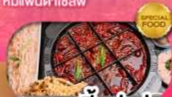
มือพิเศษ สุกี้หม่าล่า