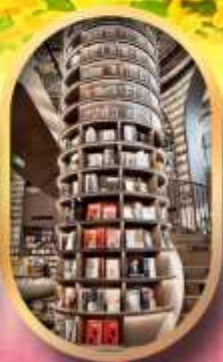
อุทยานปีเต็งโกว