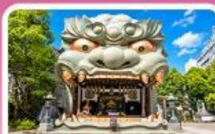
ศาลเจ้านิมมะ ยาชากะ