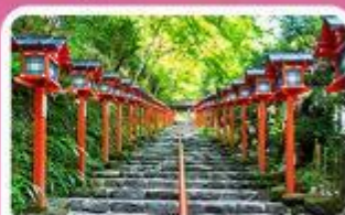
ศาลเจ้าคิฟูเนะ