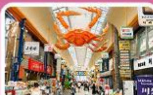
ตลาดคูโระงะ