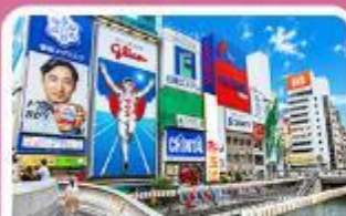
ชิบโซบาชิ