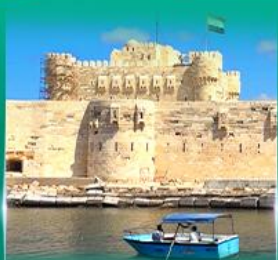
บอมปรการ Quite Bay