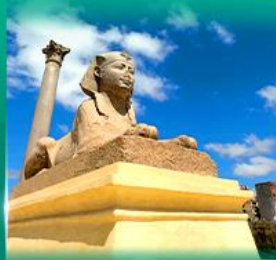
เสาสีมันบอมเบย์