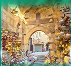
ตลาดท่านเอลกาลลี