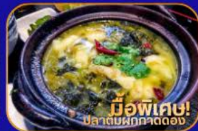
มีพิเศษ! ปลาต้มผักกาดดอง