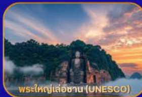
พระใหญ่เล่อซาน (UNESCO)

ล่องเรือชม "พระใหญ่เล่อซาน" - เมืองโบราณหวงหลงซี - แพนด้าเซลฟี่ - ห้างสรรพสินค้า - Wangjianglou Park - ถนนชุนซีลู่ (แหล่งช้อปปิ้ง) - IFS (แพนด้าปีนตึก) - วัดต้าเจี๊ว