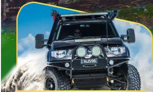
คันรถ 4WD สู้อีกกลางเทือกเขาคอเคซัส