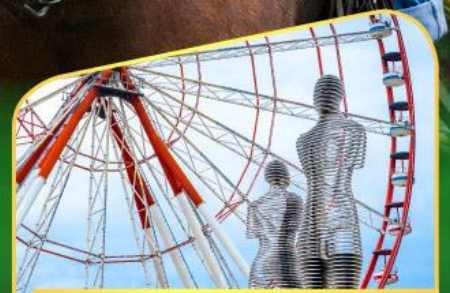
อนุสาวรีย์อาลีและนีโน่