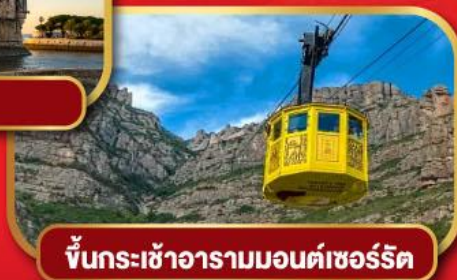
ขึ้นกระเช้าอารามมอนต์เซอร์รัต