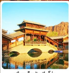
เมืองเล็กตันเสี่ยโซ่ว