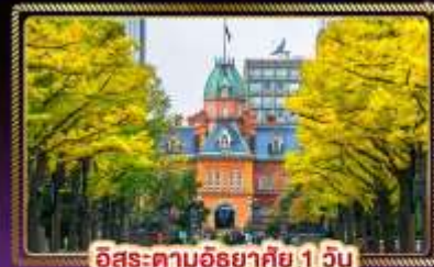
ฮิโระ-ตามฮิโระ 1 วัน

น้ำหนักกระเป๋า 20 Kg. บริการอาหาร บนเครื่อง ไป-กลับ