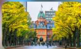
อึสระ-ตามอึธยาศึย 1 วัน