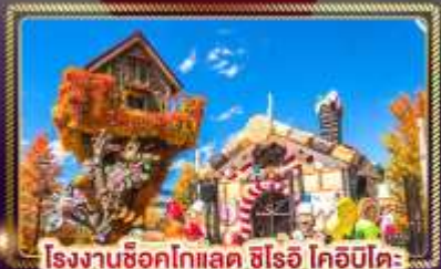
โรงงานช็อคโกแลต ชิโรอิ โคอิบิโคะ