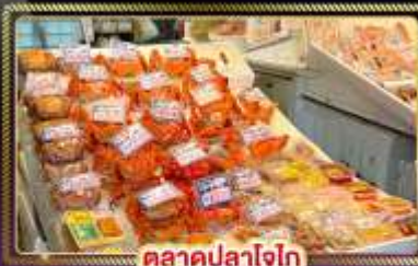
ตลาดปลาโอไก