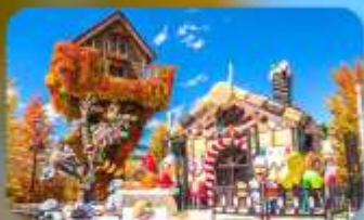
โรงงานช็อกโกแลต ซึโรอิ โคอิบึโตะ