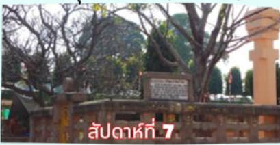
สัปดาห์ที่ 7 ราชายณะ (จำลอง)