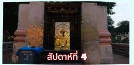
สัปดาห์ที่ 4 รัตนขรเจดีย์ (ขุมเรือนแก้ว)

เรียบร้อยแล้ว นำคณะจาริกบุญสวดมนต์ทำวัตรเย็น บูชาพระรัตนตรัย และสวดมนต์บูชาสังเวชนียสถาน จากนั้นเชิญท่านทำศนาธรรม นั่งสมาธิปฏิบัติบูชาตามอัยาศัย สมควรแก่เวลา นัดหมายเวลาเชิญท่านกลับโรงแรมที่พัก