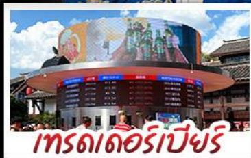
เกรตเตอร์เบียร์