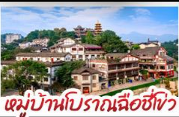
หมู่บ้านโบราณฉือซีโจว

พระแกะสลักหินตัวจู้ - ตึกตะเกียบ Raffles City - ตึกยูยชิ่ง เกรตเตอร์เบียร์ - หมู่บ้านโบราณฉือซีโจว