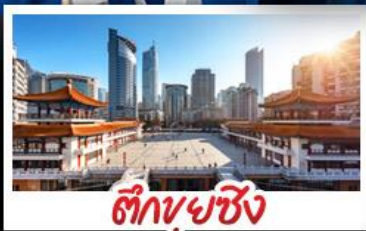
ตึกยูยชิ่ง