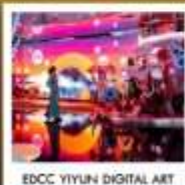
EDCC YIYUN DIGITAL ART