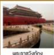
พระราชวังปักกิ่ง