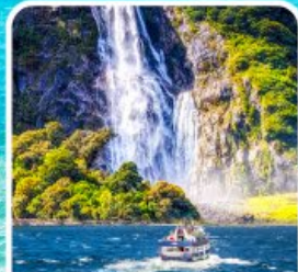
บิลฟอร์ด ซาวด์ นิ่งเรือชมความงาม พยอร์ด