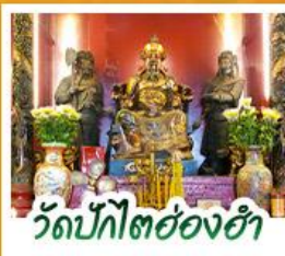
วัดปึกโตย่องฮ่า