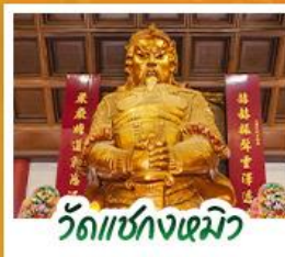
วัดเซกซงฮิว