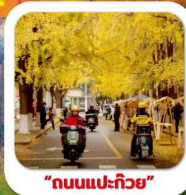
"ถนนแปะก๊วย"

นั่งกระเช้าชมภูเขาหวางอู่ซาน ขุนเขาใบไม้แดงอันดับหนึ่งของประเทศจีน เมืองชู่หยหนิง วัดหลิงจวน (วัดเจ้าแม่กวนอิมกะพริบตา) - ฟาหีนแกะสลักต้าจู้ หงหยาดัง ถนนแปะก๊วย ตึกตะเกียบ วัดหลัวซัน ล่องเรือชมวิวฉงชิ่ง