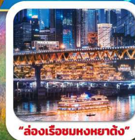
"ล่องเรือชมหงหยาดัง"