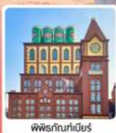
พิพิธภัณฑสถานแห่งชาติ