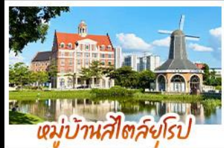
หมู่บ้านสไตล์ยุโรป

ล่องเรือชมดอกไม้สีขาวบานเหนือสายน้ำ ณ เมืองคูอินเสียงส่าย หนึ่งในปีหนึ่งครั้ง ถ่ายรูปเช็คอินแบบชิคๆ ณ หมู่บ้านสไตล์ยุโรป • ชม UNSEEN แห่งป่าหม่า ล่องเรือชมทะเลในท่า ถ้ำ ซิมเหมินไห่ เหมือนแคคตัสสวรรค์ • ชมน้ำพุร้อนฟ้า ที่ท่องเที่ยวระดับ 4A • ชมความอลังการของ น้ำตกสองแผ่นดิน จีน-เวียดนาม ณ เต๋อเทียน • ทำน้ำแข็งหลอดกับประติมากรรมน้ำแข็งสวยงาม และอากาศดีคลับ • ชมดอกไม้คามฤกษ์กาล ณ เวาซิงชิว พร้อมขอพรเจ้าแม่กวนอิมพันกษ