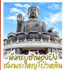
นั่งกระเช้ามองปิง ชมพระใหญ่ไป่หวล

นั่งกระเช้ามองปิงสักการะพระใหญ่ไป่หวล • วัดหวังต้าเซียน ขอพรสุขภาพ ความรัก วัดเขกงหนิว ขอพรองค์เซกุง โชคลาภ การเงินและธุรกิจ • เจ้าแม่กวนอิมรพีลาลัย ธิปพลังงานดี เสริมพลังฮวงจุ้ย • วัดหมื่นโหมว ขอพรเรื่องการศึกษ การงาน สติปัญญาและความกล้าหาญ