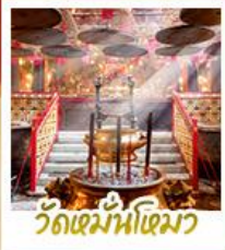
วัดหมื่นโหมว