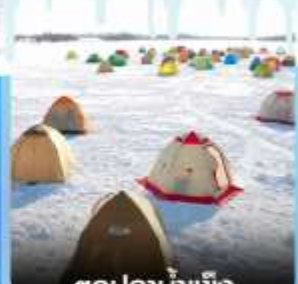
ตกปลาน้ำแข็ง