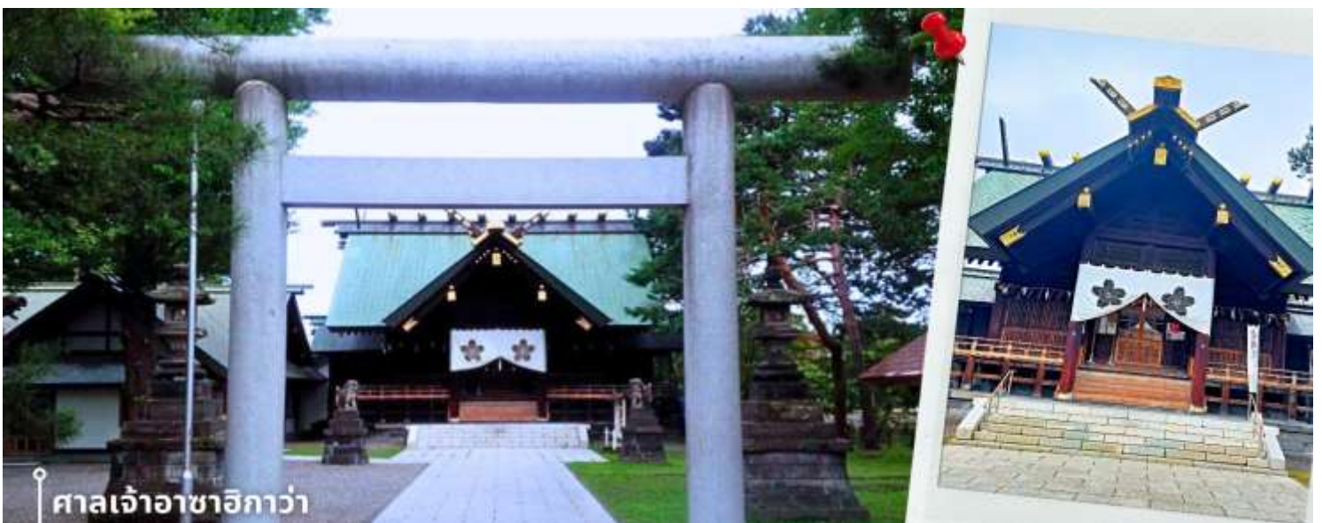
ศาลเจ้าอาซาฮิกาวา

หลังรับประทานอาหารเช้า นำท่านเดินทางสู่ ศาลเจ้าอาซาฮิกาวา เป็นศาลเจ้าชินโตเก่าแก่ประจำเมืองอาซาฮิกาวา จังหวัดฮอกไกโด เป็นศูนย์รวมจิตใจของชาวเมืองและสถานที่ประกอบพิธีตามความเชื่อของศาสนาชินโต ภายในศาล