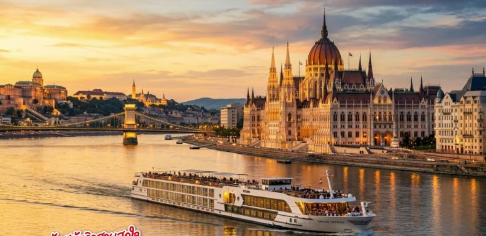
อัลสตัดท์วิวสวยสุดใจ