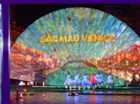
Sac Mau Venice Show