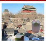
คาเฟ่ น้ำตาล