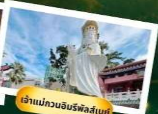
เจ้าแม่กวนอิมรฟัลส์เบย์