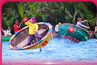
ล่องเรือกระดัง หมู่บ้านกิมทาน