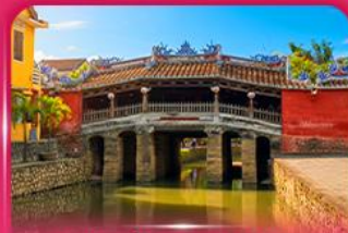
สะพานญี่ปุ่นโบราณ ฮอยอัน