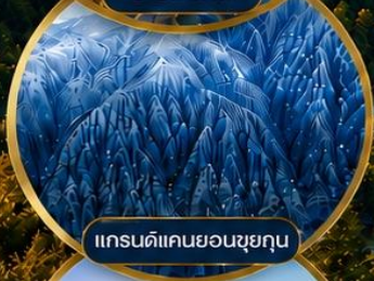
แกรนด์แคนยอนซูยคุน