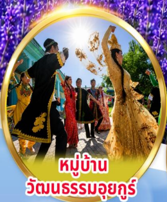
หมู่บ้าน วัฒนธรรมอุยกูร์

พิเศษ นั่งรถม้า + ซิมไอศกรีมอุยกูร์ ชมการแสดง