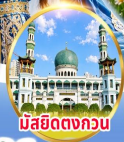
มัสยิดตงกอน

พิเศษ!! จีนภายใน 2 ชาติ เดินทาง ก.ค. - ต.ค. 69