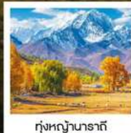
ทุ่งหญ้านาราที

ทัวร์คุณธรรม ไม่ลงร้านช้อปปิ้ง ไม่ขายออฟชั่น