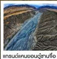
แกรนด์แคนยอนตู้ซานจื่อ