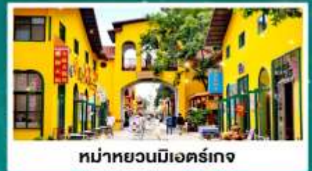
หมู่บ้านมื่อเออร์เกง