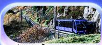
นั่งรถรางขึ้นยอดเขาฟลอยอน

เปิดประสบการณ์สุดว้าว... สักครั้งในชีวิต! ล่องเรือชมฟยอร์ด นั่งรถไฟสายโรแมนติกฟลอยอนมา เบอร์กิน ชมเมืองเก่าบรีคเกน นั่งรถรางขึ้นยอดเขาฟลอยอนชมวิวเมือง ไม่ควรพลาดนั่ง Cable car ขึ้นยอดเขาอูลริเคน ชม Top view ตระการตา ความอลังการระดับมาสเตอร์พีซ จุดชมวิวดัสตาสไนด์ เดินเล่นตลาดปลาเบอร์กิน ขึ้นชมโบสถ์ออสโลเยี่ยมชมโอเปร่าเฮาส์ มหาวิหารออสโล ป้อมปราการอาครส์ฮุส รัฐสภาแห่งนอร์เวย์ สวนอนุสรณ์ Vigeland Sculpture Park ซุปเปอร์มาร์เก็ต Karl Johans gate