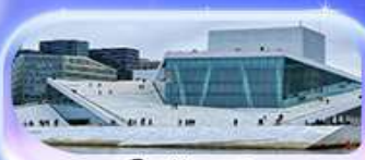
โอเปร่าเฮาส์

07-15 ต.ค.69 / 16-24 ต.ค.69 13-21 พ.ย. 69 / 04-12 ธ.ค. 69 25 ธ.ค. 69 - 02 ม.ค. 70 (ปีใหม่)