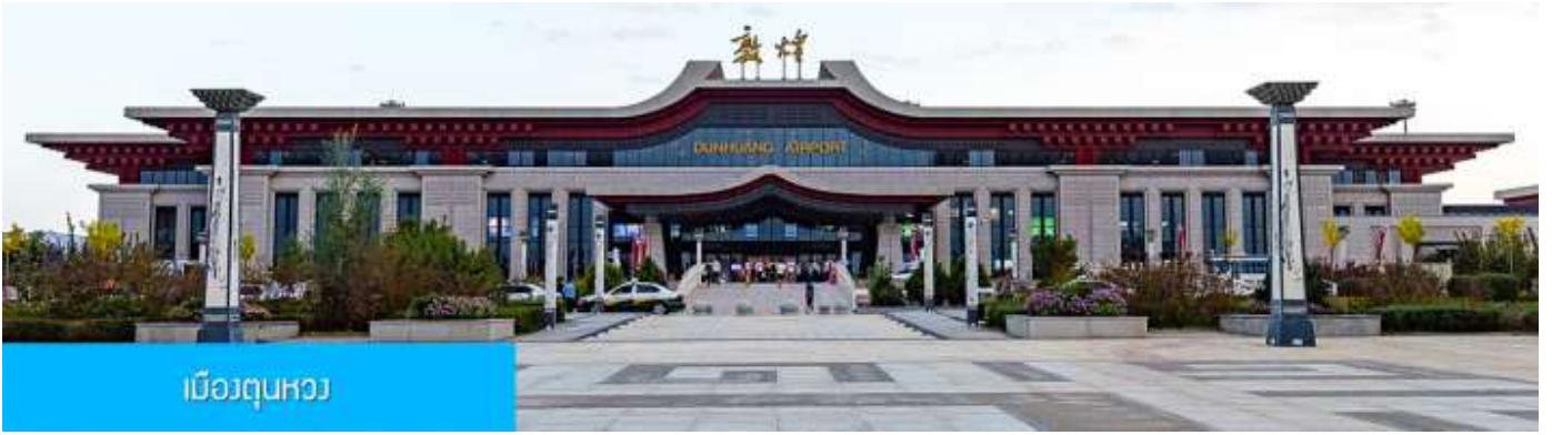
เมืองตุนหวง