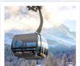
ขึ้นกระเช้ายอดเขาจุงเฟรา