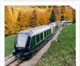
รถไฟโกลด์นพาส