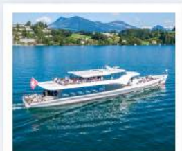
ล่องเรือทะเลสาบลูซีร์น