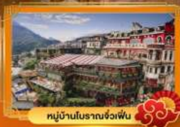
หมู่บ้านโบราณจ่งเฟิน