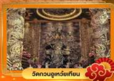
วัดกวนอูเหยี่ยวเทียน