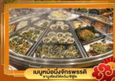
เมนูหม้อนึ่งจักรพรรดิ