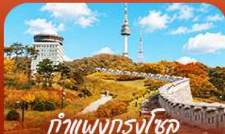
ทำแพงกรงโซลแบบบอมบ์แควร์

ออกเดินทางสู่ร่องราวแห่งฤดูใบไม้เปลี่ยนสี สัมผัสความงดงามของเกาะบาบิและอุทยานแห่งชาติชอริคซาน เพลิดเพลินกับความสนุกเต็มอิ่มที่สวนสนุกเอเวอร์แลนด์ • เก็บภาพความประทับใจท่ามกลางทุ่งหญ้าสีทอง และโบมีหลากหลายสีที่สวนฮานิลปาร์ค • พร้อมชมวิวหอคอนันซานจากแบบคอนสแควร์ • เติมเต็มความสุข ด้วยการลิ้มลองสตรีทฟู้ดรสเลิศที่ตลาดบึงวอน • ก่อนเพลิดเพลินกับการช้อปปิ้งในกรุงโซลตลอดทริป