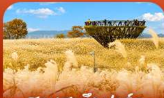
สวนฮานิลปาร์ค