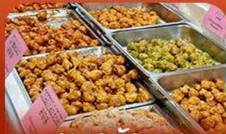
ตลาดม้งวอน