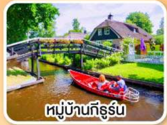
หมู่บ้านทีร์ูร์บ