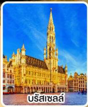
บรีสาซลล์