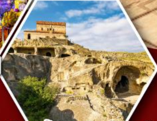
เมืองถ้ำอพลิสตซิเคห์

พัก Rooms Hotel โรงแรมวิวหลักล้านของเทือกเขาคอเคซัส