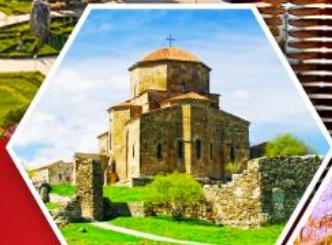
วิหารกอรี