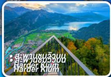
• สะพานชมวิวยอด Harder Kluem