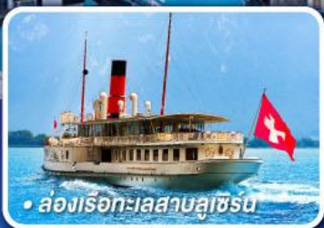
• ล่องเรือทะเลสาบลูซิร์น