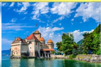
ปราสาทชิลยง