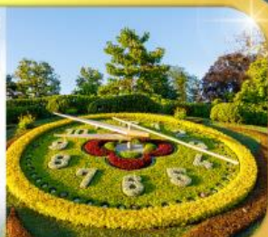
นาฬิกาดอกไม้เมืองจนีวา