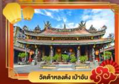
วัดต้าหลงตั้ง เป่าอัน